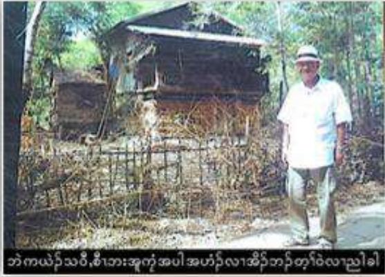
ဘဲကယဲၣ်သဝီ,စၢၤဘးဆူက့ၢ်အပါ အဟံၣ်လၢအိၣ်ဘၣ်တံာ်ဝဲလၢညါခါ

“တံာ်လၢယဖုစီၤသၣ်မ့ၣ်ကွံန့ၣ်မ့ၢ်ပုၤတဂၤလၢအဲၣ်မၤ စၢၤပုၤဂ့ၢ်ဝိတံာ်မၤတဂၤလီၤ.လီၤဆိဒ်တံာ်ယဖုန့ၣ်အ သးဆူၣ်လၢအဲၣ်ဒီးဆိၣ်ကဖိထီၣ်န့ၣ်အပုၤကလုာ်က ညီဖိတဖၣ်အခံလၢအသးကအိၣ်ယုတံာ်ကူၣ်ဘၣ် ကူၣ်သ့အဂီၢ်န့ၣ်လီၤ.ယဖုန့ၣ်မ့ၢ်ဒ်ကယၢ်ပုၤထူး ပုၤတီၤဒီးပုၤအါဂၤဟံၣ်ဒိုပးကဲအီၤဘၣ်ဆၣ်,ဖျါဘၣ် ယၤလၢအဝဲတအဲၣ်ဒီးအိၣ်ဆိးကူကၤတံာ်ဆုၣ်ဆုၣ် ဘ့ၣ်ဘ့ၣ်ဒ်ပုၤခူဖိဝုၢ်ဖိတဖၣ်အသိးန့ၣ်ဘၣ်.အဝဲကူဒ်သိးဒ်ပုၤမ့ၢ်ဆုၣ်မ့ၢ်ဂီၤဖိအတံာ်ကူတံာ် ကၤဒီးအိၣ်မ့ၢ်ဒ်ဖဲအကစၢ်သဝီဘဲကယဲးန့ၣ်ဒ်ပုၤထူစံာ်ဖိတဂၤအတံာ်အိၣ်မူအသိးန့ၣ်လီၤ. မ့ၢ်ယဖံတခီတံာ်မ့ၢ်ဘၣ်အီၤလၢဟးတခွဲအိၣ်ညၣ်လၢထံကျိပူၤဒီးပုၤခဲလၢာ်ကိးဒ်အီၤလၢ “မိဒိၣ်”န့ၣ်လီၤ.