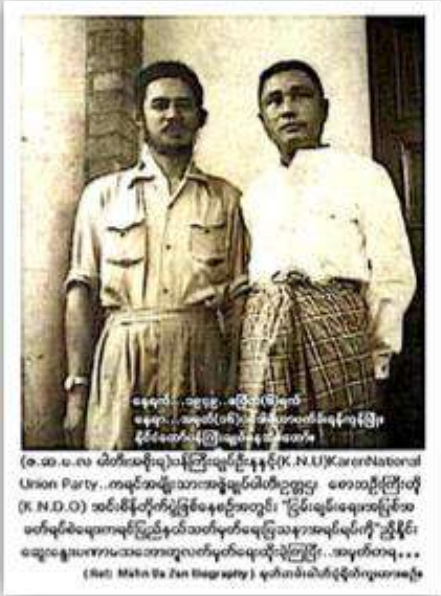
ဖေဖေ... ဝေဝေ... ဝေဝေ... (K.N.U) Keren National Union Party... အဂီၢ်အဖျၢၣ်သးအဖျၢၣ်ဝဲတံၣ်တံၣ်ဖျုဖျု (K.N.U.O) ဆိၣ်သးခိၣ်နီၣ်တဖၣ်ဟ့ၣ်ကူၣ်စီၤဘးအူကံၤတူၢ်လိာ်ဝဲကညီခိၣ်နီၣ်သးပှၢ်တဖၣ်အတၢ်ဟ့ၣ်ကူၣ်အံၤဒီးဟးထီၣ်ကွံၣ်ဝဲလၢကိတိၣ်လီၤလၢန့ၣ်မ့ၢ်ကဆုလီၤ... (Ref: Maha Ya Zan Biography) မ့ၢ်တခီကဘၣ်ယုဟးထီၣ်ကွံၣ်လၢကိတိၣ်လီၤ

ယုထိန် “ကညီကီၢ်စဲၣ်လီၤဆီ” ဆူအဲကလံးပဒိၣ်အအိၣ်န့ၣ်လီၤ.တၢ်ဂ့ၢ်အံၤသးခိၣ်ကျၢၢ်အိၣ်ဆါထီဒါဝဲတံၣ်တံၣ်ဖျုဖျုလၢတၢ်အိၣ်ဖိၣ်အပူၤန့ၣ်လီၤ.လၢတၢ်န့ၣ်အယိခ့ၣ်အဲၣ်ယုၣ်ခိၣ်နီၣ်တဖၣ်ဟ့ၣ်ကူၣ်စီၤဘးအူကံၤလၢအသုတန့ၣ်လီၤဒီးယုထၢအသးအသီတဘျီလၢဘျီၣ်ခိၣ်တၢ်ယုထၢလၢတဂ့ၤ,မ့ၢ်တခီကဘၣ်ယုဟးထီၣ်ကွံၣ်လၢကိတိၣ်လီၤလၢအံၤ,လၢကကဲထီၣ်တၢ်ဆိၣ်သနံးပဒိၣ်အဂီၢ်န့ၣ်လီၤ.လၢအပူၤကလုၢ်အတၢ်ဘၣ်ဘျးအဂီၢ်စီၤဘးအူကံၤတူၢ်လိာ်ဝဲကညီခိၣ်နီၣ်သးပှၢ်တဖၣ်အတၢ်ဟ့ၣ်ကူၣ်အံၤဒီးဟးထီၣ်ကွံၣ်ဝဲလၢကိတိၣ်လီၤလၢန့ၣ်မ့ၢ်ကဆုလီၤ.